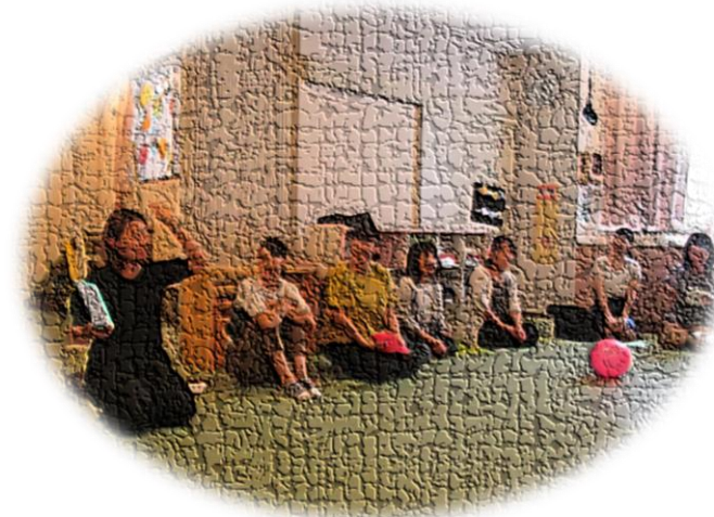
ボール遊びのおもしろさって？

次回は10/12(土)の開催です。「ADL 日常生活動作をスムーズに行うアイデアいろいろ」をテーマに姿勢、そして普段の生活の中での着替え、移動、様々な動作、どうしたらいいを皆さんでお話&交流会をしたいと思います。11月は「食欲の秋！食べるをテーマに食事・嚥下に関して」をテーマにします。お申し込みはメールか電話にてお申込みください。