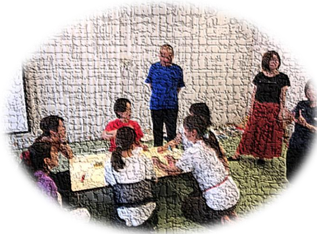
実際に自助具を使って食べてみると・・・

保育・教育・児童発達支援等で障害のあるお子さんに関わる支援者を対象にワークショップを開催しています。8月は“自助具いろいろ”をテーマに実際の自助具を使っての食事や運筆などを体験し、子ども達がなぜこのような自助具を使っているのか、こういった機能があるのかを話合いました。9月は“運動遊びいろいろ”をテーマにマット運動や縄跳び、ボール遊び等、そのものの醍醐味（それって何がおもしろいん？）をテーマに意見の交換やアイデアの共有を行いました。後半もまだまだ続きますのでどなたでもお気軽にご参加ください。